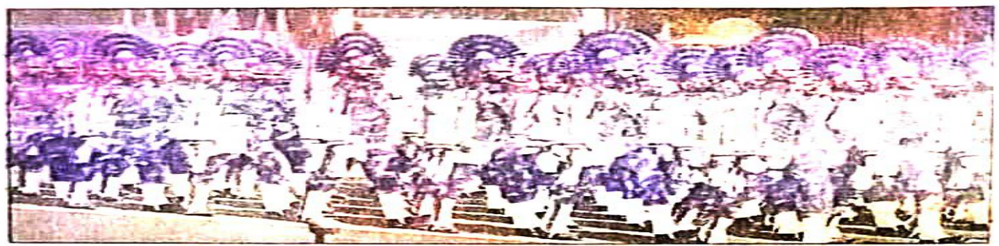
परेड में शामिल आरएएफ बटालियन के जवान। संबद

सीआरपीएफ जवानों अहम योगदान है। देश को आंख दिखाने वाली बाहरी ताकतों से मुकाबला आतंकवाद, नक्सलवाद के के लिए सीआरपीएफ के जान की बाजी लगा देते हैं।